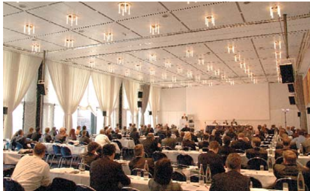
Die unternehmensrelevanten Diskussionen finden hier statt – im Grand Hotel Esplanade Berlin.