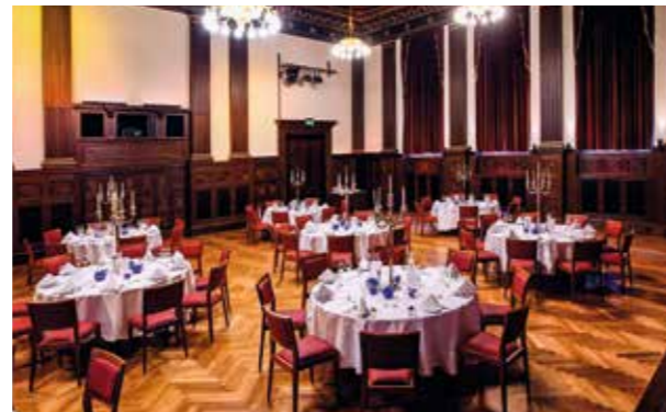
Festlicher Abendempfang anlässlich des 40. Jubiläums der Arbeitsgemeinschaft im Meistersaal in der Köthenerstr. 38 (unweit des Potsdamer Platzes)