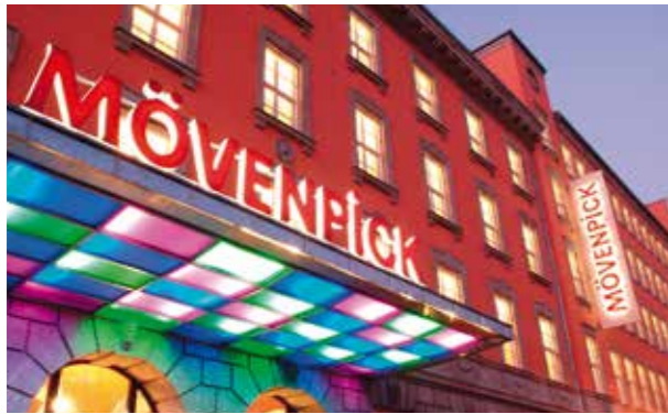
In diesem Jahr finden die unternehmensrelevanten Diskussionen im Mövenpick Hotel Berlin statt.